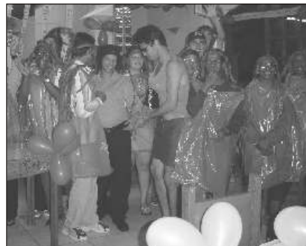
Gincana: empenho nas tarefas foi total

Nos dias 10, 11 e 12 de dezembro a AGASAI realizou sua festa de encerramento de ano na Praia de São Pedro, na Colônia de Férias da Apresul. Dezenas de associados com seus familiares prestigiaram a festa que contou com gincana, baile, sorteio de brindes, promoções de natal com distribuição de presentes para as crianças e claro, muita praia. Todos já estão convidados para 2005.