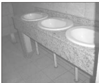
Banheiros em fase de acabamento