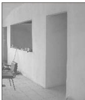
Entrada para os quartos

Haverá também área destinada para camping com diárias de R$ 3,00 por pessoa (sócios não contribuintes R$ 4,00) por um período máximo de uma semana podendo ser renovado caso haja disponibilidade. As refeições serão servidas a parte no refeitório da Sede, e não estão incluídas nos preços das diárias. Cada usuário deverá providenciar roupa de cama e banho. As reservas devem ser feitas com antecedência diretamente na AGASAI. Sócios que estão contribuindo terão prioridade na reserva.