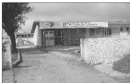
Uma parte da Sede vista da entrada do terreno