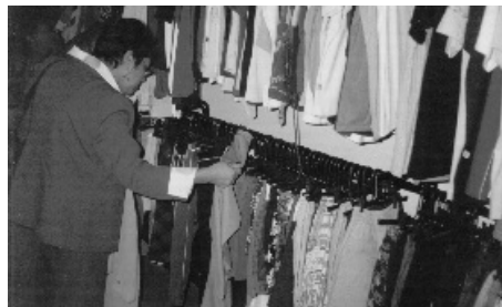
A Loja destaca-se pela variedade de produtos

de associados. Na ocasião foi servido coquetel aos presentes, que puderam apreciar e conferir as novidades da Loja.