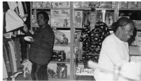
Sócios aprovaram as novas instalações

Para melhorar os serviços oferecidos aos seus associados a AGASAI busca atender às necessidades do quadro social, através de um trabalho que otimize custos e privilegie a qualidade. Sendo assim a AGASAI terceirizou a sua loja de variedades passando-a para a