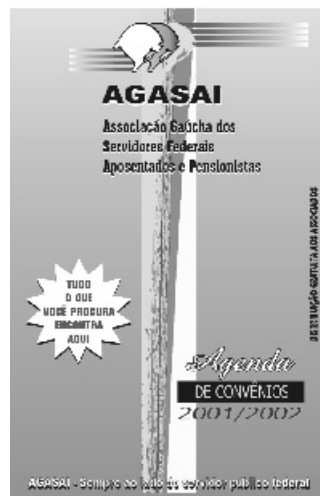
Agenda de Convênios 2002

Esperamos que esta agenda torne-se uma referência para todo o associado da AGASAI e que venha suprir as necessidades e anseios de todos.